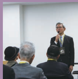
トークショー 阪神電気鉄道株式会社 木戸 洋二 副社長