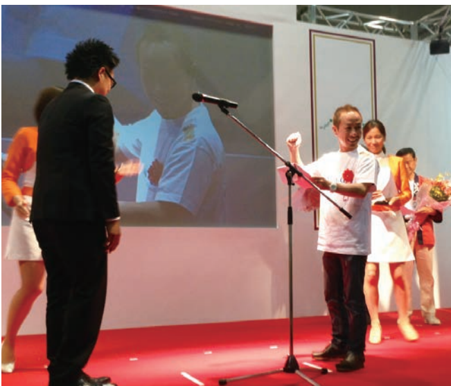
中小企業総合展 2013 in KANSAI WAZA 自慢コンテスト アイディア部門 優秀賞

このような紆余曲折を経て、いま自社の主軸となっているのは、クラウドサービスと iPhone や Android を活用したアプリケーションの企画・開発・運営・発信・サポート、セキュリティ等です。