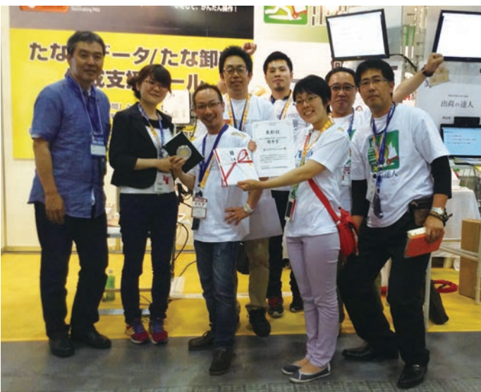
中小企業総合展 2013 in KANSAI WAZA 自慢コンテスト アイディア部門 優秀賞

また、これまでCCOの交流会には参加できていませんでした。このインタビューを機会に「若手経営者の会」などには積極的に出席し、経営者同志の親交も深めていきたいと思っています。