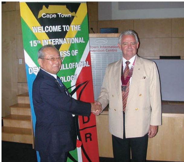
南アフリカでの国際会議で名誉会員に推荐される

人生で「この人と友達になれて本当に良かった」と心から思える友人を多数持つ人は幸せだと言えます。私はこれからも、人との出会いや関係を一番大切にしていきたいと思っています。長年にわたり築いてきた人脈は、かけがえのない財産です。人とのつながりは、ビジネスからプライベートまで、あらゆる場面で最も貴重なものでしょう。それを側面からサポートするガーデンシティクラブ大阪という団体は素晴らしい組織ですし、これからもっと発展していつてもらいたいと願っています。