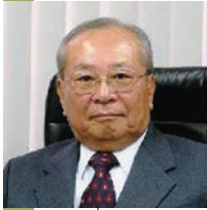
大阪大学 名誉教授