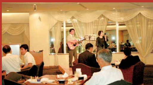
参加者の皆様も熱唱