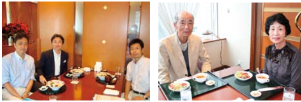
チャリティーランチにご協力いただいたお客様