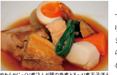
やわらかじゅり煮込んだ豚の角煮とろ〜り煮玉子添え

被災地の復興に、微力ながらもお役に立ちたい。前回ご紹介したアクティビティ・コミッティのチャリティーイベントのように、東日本大震災以降、各コミッティはさまざまな活動を展開しています。