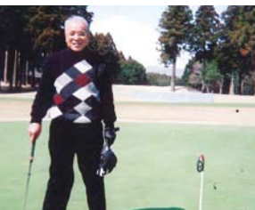
大平洋クラブ 御殿場コースにて

以前、尊敬する方から「コベの順位表で、いつも上位にいる人は、前向きに興味を持つ人、逆にいつも下位の人は、諦めの早い人。ゴルフの成績は、そんなふうに見られるのだよ」と、教えていただいたことがあります。私は「なるほど」と思い、それ以降いっそう練習に励み、二時期は憧れのシングルにもなれました。ゴルフがうまくなると、あちこちから「社長のプレーに付き合ってください」「事業部長の組に入ってください」とお声がかかるようになり、ど