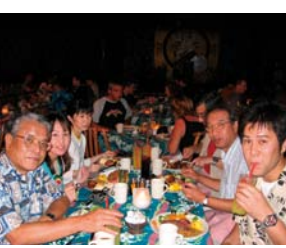
社員旅行 ハワイにて

意外に思われるかもしれませんが、あまり知らないでない店のビブシチューや焼き焼き、カツサンドなどの隠れた名物を、東京をはじめ遠方からいらしたお客様をご案内しますと、大いに喜んでいただけます。高級料亭の懐石料理と