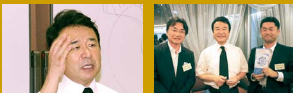
青山 繁晴氏 懇親会にて

『祖国は甦る』と題し、株式会社独立総合研究所 代表取締役社長 兼 首席研究員 青山繁晴氏より、実際に現地で見えてきた「福島原子力災害」、「震災後の日本の経済と社会」、「日本政治」、「敗戦後の日本」、「メタンハイドレード」など様々な議題について、予定時間を大幅に延長していただき、壇上から降り参加者と同じ目線で、熱く語られました。懇親会でも、参加者ひとりひとりと名刺交換や個々の疑問も活発に行なわれ、盛大のもとに終了致しました。