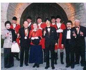
フランス ブルゴーニュ「クロド・ヴァージ」での祝賀式にて

プライベートの話になりますが、私はワインが大好きです。これはおそらく、大阪でワインの間屋を営んでいた祖父の影響でしょう。祖父の間屋では、山梨県のワイン製造会社サドヤからブランドワイン「シャトーブリアン」を仕入れて、レストラン「アラスカ」百貨店などに卸していました。