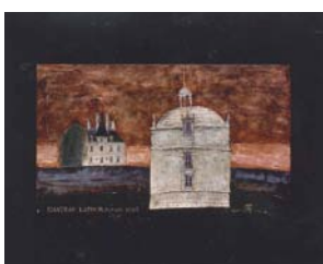
フランス ワインシャトー「シャトー・ラトゥール」

又若い頃は夏と冬に長めの休みをとり、毎年2回、フランスの田舎の葡萄畑めぐりをしていました。そこで誰も知らないような安くて美味いワインを発見することが、旅の醍醐味でした。現地の人に騙されることもしょっちゅうありましたが、そんな珍道中で自分自身の幅が広がったと感じています。そのため、若い社員には「夏は9日間海外に行きなさい。冬は5日間やりたいことをやりなさい」とよく言っています。