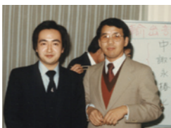
渡米前日放送会 20代の頃

アメリカ時代に、アメリカ人の友人数人とロサンゼルス→シアトル→ニューヨーク→フロリダ→ロサンゼルスと1ヵ月余りかけて全米一周旅行をしたのが、何よりの思い出になっている。この間は、日本語なしの生活だった。