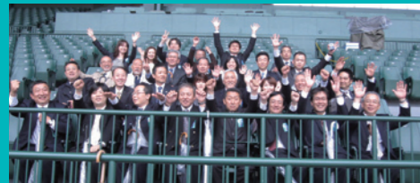
グリーンシートにて記念撮影