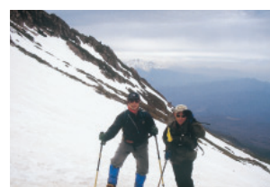
木曾御嶽山(八合目)

からの企業で最も大切なことは、コンプライアンス経営の実現です。遵法意識の向上と遵法行動の徹底を図るために、社員教育が求められ、公正かつ健全な企業活動を展開することが大切ではないでしょうか。社会の信頼を失う言動は、厳に慎むように役員・同僚の注意を払っている。「大阪ガーデンシテイクラブ」には、大阪支店に赴任して以来8年間、素晴らしい想いの場を提供して頂いている。そして、昨年アクティビティ・コミッティのメンバーに推挙して頂いたことで、より身近に感じようになりました。今年の大忘年会は、参加者全員に楽しんでもらえる工夫を凝らしたいと思っています。