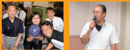
チーム一丸となって!