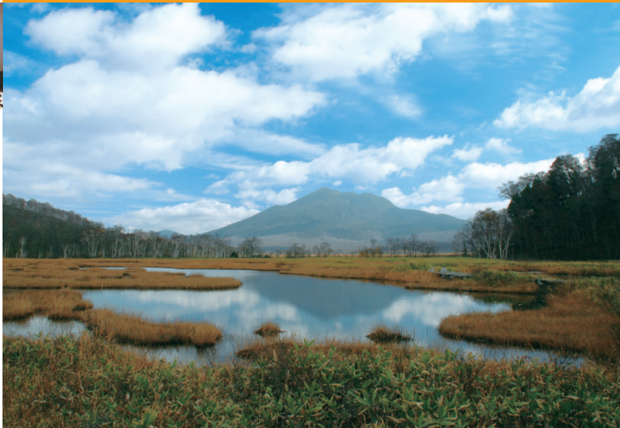
尾瀬ヶ原(中田代)から燧ヶ岳を望む