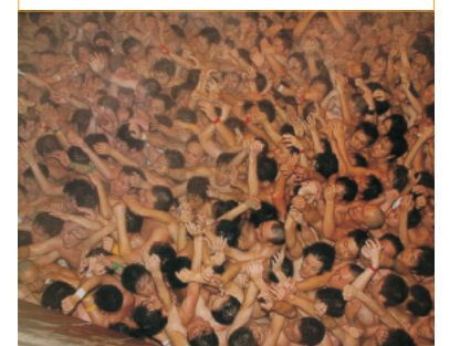
西大寺の裸祭り(会陽)