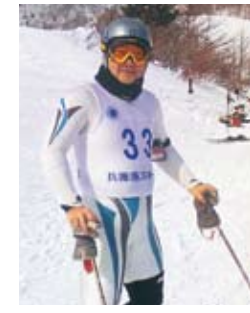
兵庫県スキー連盟のスキー大会で

ーズ大会に出るほどで、大学時代のシーズンは、上越や信州のゲレンデが教室だった。回転が得意種目で、東京都の大会では15人の第2シードにも入っていた。日立建機にお世話になったのも、スキーが続けられるというのが、最大の理由。そう、大学の先輩に加山雄三さんがおられ、そのご縁でコンサートを中野サンプラザでプロモートし、収益の30万円で全塾大会の優勝旗を作製したことも。テニスも子供のころからやってきたが、不惑の歳に、体に優しいゴルフ派に。以来、週1回のラウンドと、その前の練習を楽しみに。スキーもゴルフもそうだが、ちょっとしたコブやアンジュレーションへの対応いかなが、結果を大きく左右する。練習、経験はもろろん大事だが、私はそれ以上に成否の原因を徹底して考え抜くことにしている。「必要は発明の母」と