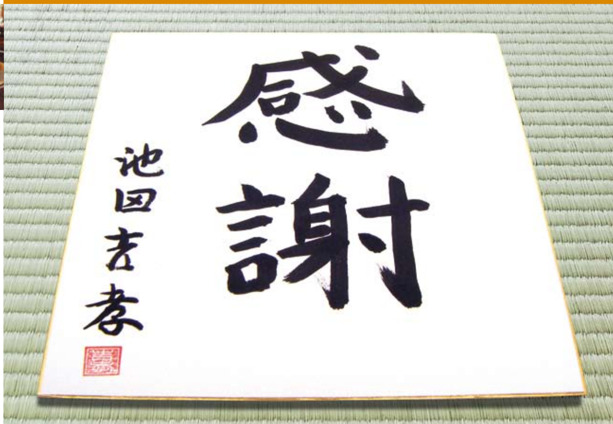
ガーデンシティクラブ大阪 会員番号001の男