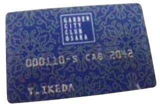
会員番号 001のカード 〔「110」が会員No.1を表しています〕

懐徳堂、滴塾やさらに「タニマチ」などという言葉にみられるように、船場商人に代表される大阪町人には、見返りを求めることなく、社会に貢献するDNAが流れていた。「制服はどれも本社発注。大阪本社の減少の影響は大きい」と悩まれながらも、日本服地卸商組合連合会理事長、なんなんタウン商店街振興組合副理事長など両手に余る世話役を涼やかにこなされている池田さんを見てみると、「町衆」とか「旦那衆」といった昔の言葉が甦る。祖父が阪神電鉄の大株主の時期もあった。村山実、小山正明といったかつての阪神タイガースの優勝メンバーが野田誠三社長に伴われて自宅に挨拶にきたetcといったお話には、池田家120年の歴史の奥行きを感じさせられた。昨年のNAMBAなんなん大阪弁川柳コンテスト(なんなんタウン商店街振興組合主催)の入賞作を披露しながら、「大阪を元気にしなければ」「橋下知事には共感が持てる」「阪神間など大阪近郊を巻き込んだ大行政区の実現で私たちにも大阪の選挙権を」といった言葉が自然に出てくる。お座敷では都々逸も披露されるという池田さん。制服とは対極の「軽妙洒脱」が背広を着られたような粋な方だ。(編集子)