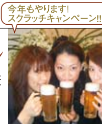
今年もやります! スクラッチキャンペーン!!!